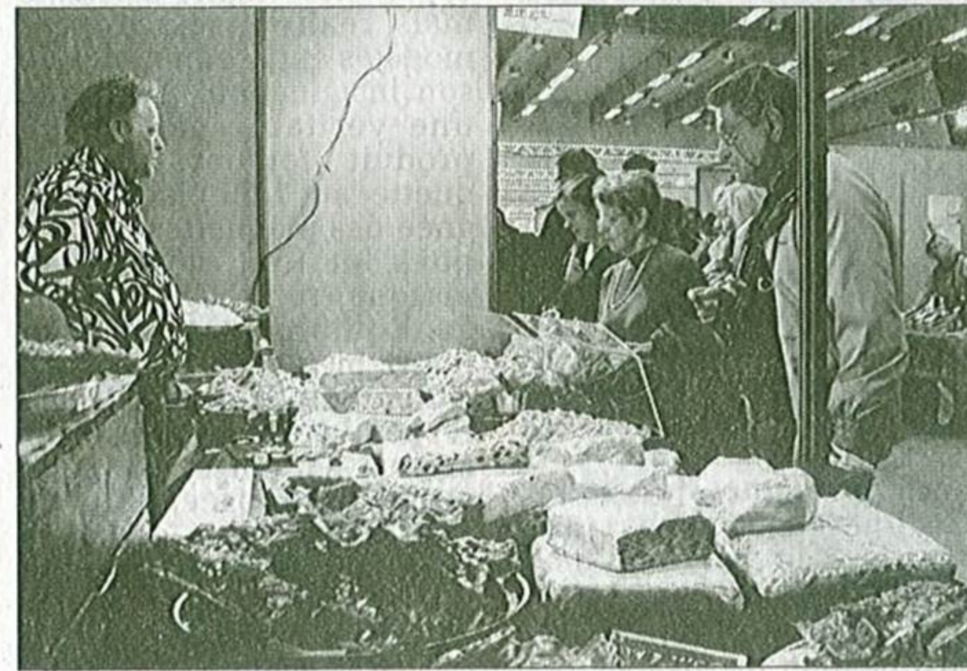
■ Des nougats à tournebouler les papilles gustatives.

La deuxième édition du Salon des vins et des saveurs est prometteuse à l'Espace Pourny.